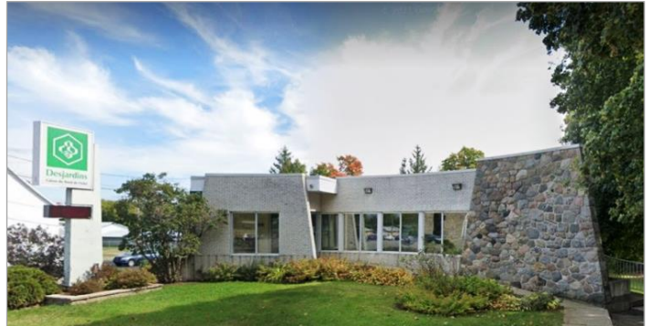
Le Centre de services Saint-Aubert de la Caisse Desjardins du Nord de L'Islet.

Le maire Ghislain Deschênes a accordé des entrevues à divers médias régionaux. Voici en trois liens internet une revue de presse non exhaustive de la couverture médiatique entourant cette annonce :